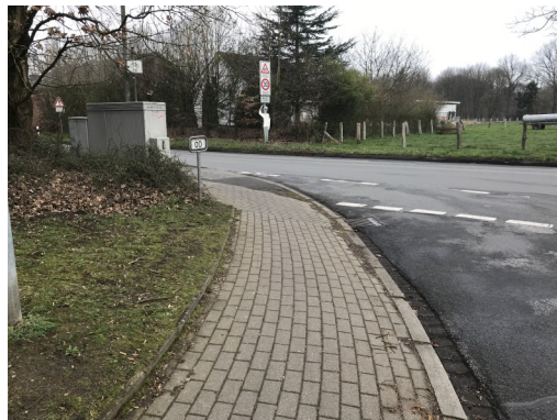
Abbildung 2: Hier kann es eng und unübersichtlich beim Abbiegen werden!