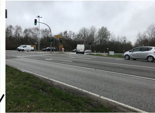
Abbildung 3: Vorsicht beim Straßenqueren an der Fußgängerampel!

Detailpläne finden Sie unter https://www.wentorf.de/Bildung-Kinder-und-Jugend/Schulwegplanung