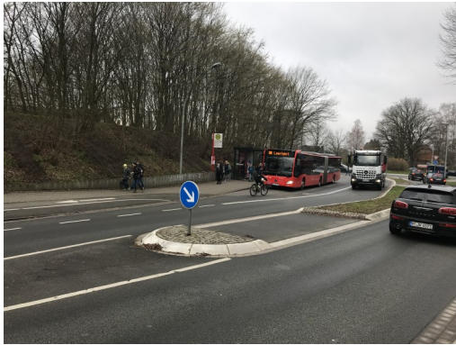
Abbildung 1: Hier soll von den Fahrradfahrern die Überquerungsinsel beim Straßenwechsel vor der Bushaltestelle benutzt werden!